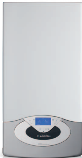
GENUS PREMIUM EVO 25 kW