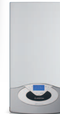
GENUS PREMIUM EVO

Genus Premium EVO 24-30-35 FF Clas Premium EVO System 18-24 FF Genus Premium EVO System 12-18-24-30-35 FF Egis Premium 24 FF Genus Premium Solar FS 12-25-35 FF Clas B Premium 24-35 FF Genus Premium EVO HP 45-65-85-100-115-150 kW Genus Premium EXT 25 FF Clas Premium EVO 24-30 FF Genus Premium Solar In 25 FF Genus Premium In 25 FF Genus Premium In System 25 FF Egis Premium In 25 FF