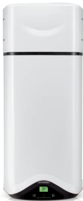
NUOS EVO 80 LT